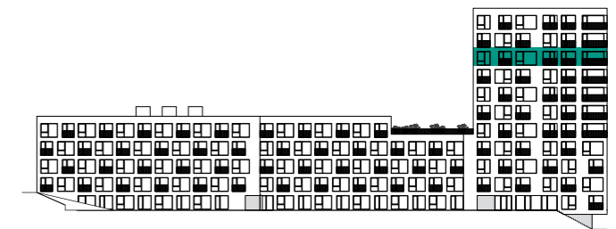
PLÁN PODLAŽÍ | FLOOR PLAN