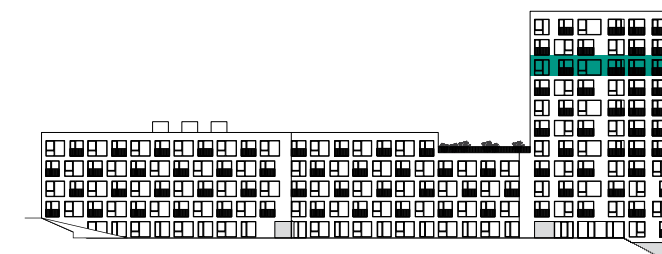
PLÁN PODLAŽÍ | FLOOR PLAN