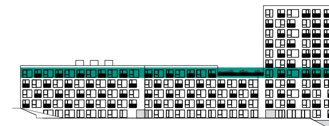
PLÁN PODLAŽÍ | FLOOR PLAN