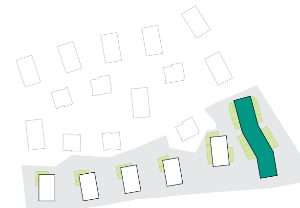
ULIČNÍ POHLED | BUILDING VIEW