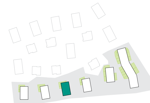
ULIČNÍ POHLED | BUILDING VIEW